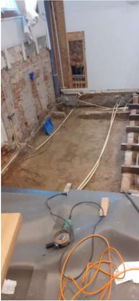
Vloer van de kerk