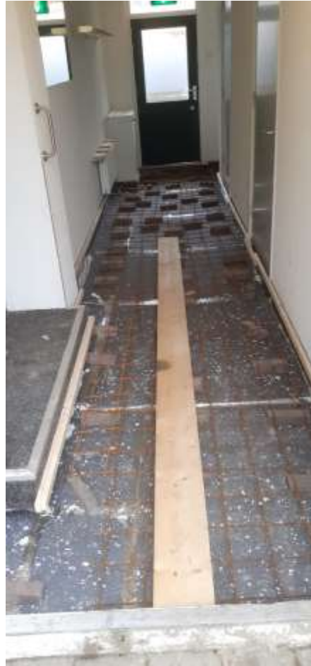
Vloer in het halletje